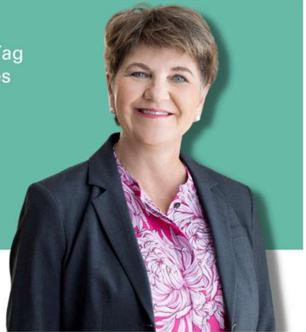
Viola Amherd Bundespräsidentin

« Es ist eine schöne Tradition, dass viele Menschen an diesem Tag bewusst da sind für jene, denen es nicht so gut geht. »